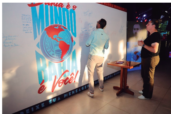
Ações de reconhecimento durante Festa de Confraternização de fim do ano de 2025